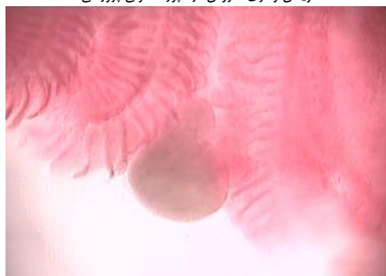
شکل ۳: تصویر میکروسکوپی نمونه تحت تیمار با آویشن از انگل اکتیوفتیریوس در آبشش ماهی کپور پرورشی ( Cyprinus carpio )

نتایج تیمار با آویشن با غلظت ۲۰۰ میلی‌لیتر بر لیتر که اولین غلظت انتخابی جهت مبارزه با انگل‌های خارجی در پوست و آبشش پس از گذشت چهار روز بود، در بزرگ‌نمایی میکروسکوپی ۱۰ و ۱۰۰ گسترش میکروسکوپی نمونه‌برداری از بخش‌های خارجی ماهی‌ها این داروی گیاهی روی تک‌یاخته‌هایی چون تریکودینا ( Trichodina ) و اکتیوفتیریوس ( Ichthyophthirius ) هیچ‌گونه تأثیری نداشته است. از طرفی در نمونه تیمار با داروی تری کلروفن با غلظت ۰/۲۵ میلی‌گرم بر لیتر پس از چهار روز دارو هرچند توانسته بود روی انگل‌های مونوژن اثر مثبت بگذارد، ولی روی تک‌یاخته‌های انگلی مانند تریکودینا و تک‌یاخته اکتیوفتیریوس هیچ‌گونه تأثیری نداشت.